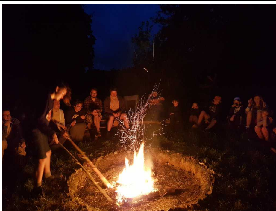
U slavnostního ohně jsme tábor symbolicky doopravdy zahájili.

Ráno jsme již měli k dispozici aut více a tak jsme přepravili na tábor většinu vedoucích a