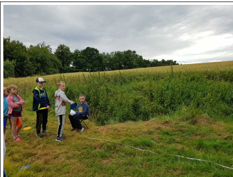
Hod diskem k Řeckému sportu jistě patří