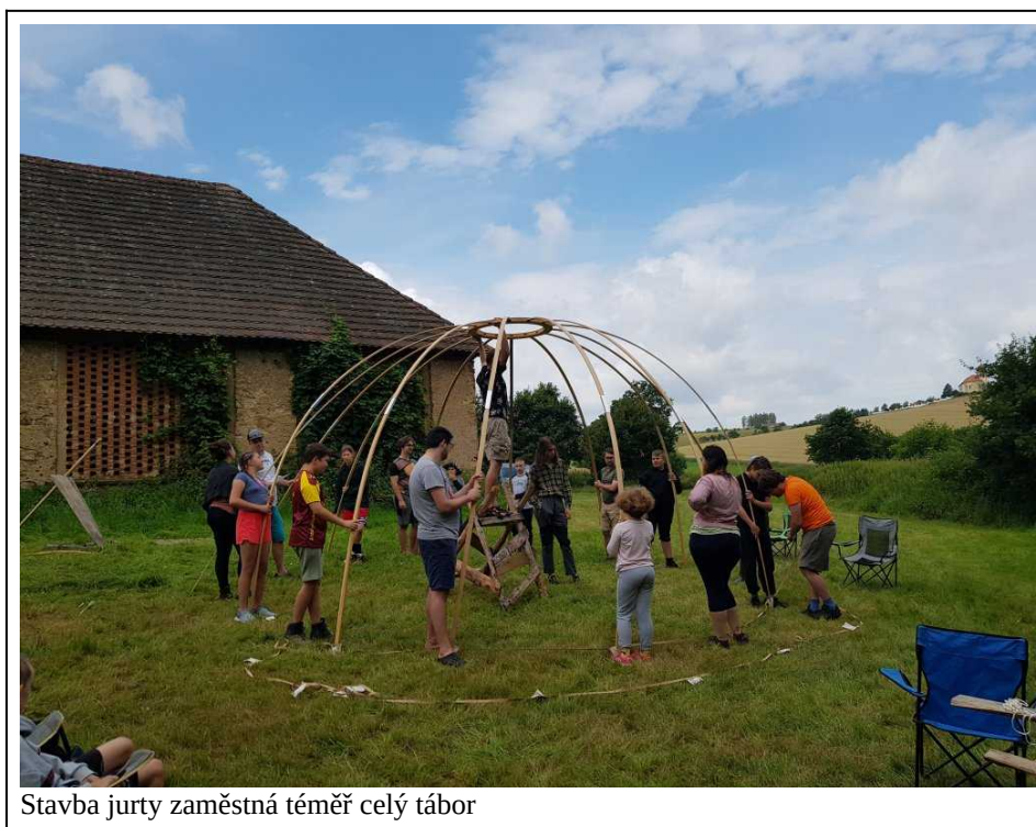
Stavba jurty zaměstná téměř celý tábor

Pondělní dopoledne s sebou přineslo poslední stavební činnost, zejména pak stavbu jurty a