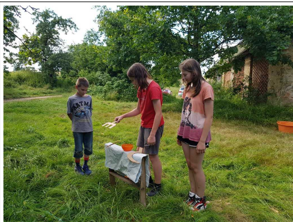
Udělat rituál bez chyby se ukázalo jako téměř nemožné.