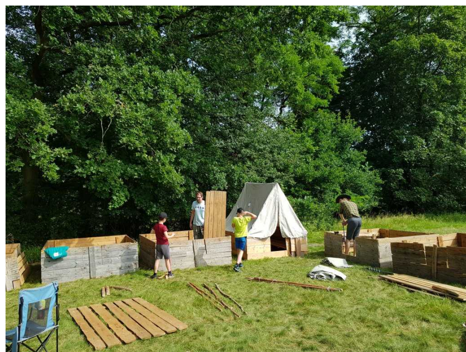
Už se to rýsuje a první stany už stojí.

Letos nás na táboře bylo o něco málo méně než v rekordním loňském roce, nicméně stále jsme byli druhý nejpočetnější tábor oddílu a měli jsme plno dětí i vedoucích, abychom naplnili tábor hrami, soutěžemi, výrobami všeho možného a i obyčejným táborovým životem, povídáním a díváním se na přírodu. Příjezd se nám v pátek mírně zkomplikoval, když nezkušený řidič autobusu odmítl projet cestou až na tábořiště a tak jsme celý náklad vozili v jednom autě a jen několika málo osobách. Ovšem když