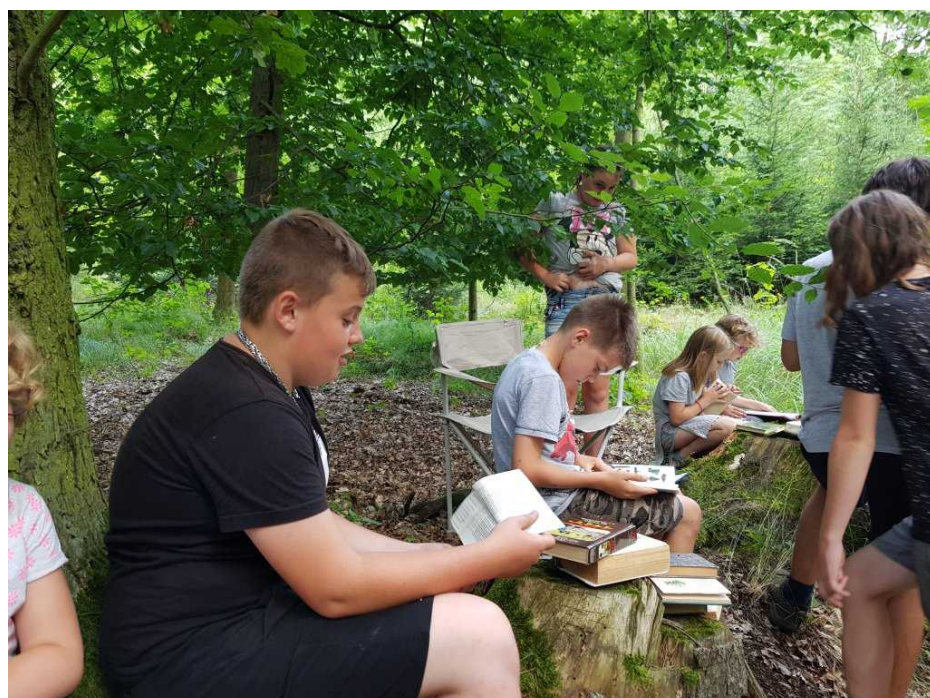
V Daidalově pracovně se hledala v knihách konstruktérova šifra, náhoda tomu chtěla, že se tu našlo i ledacos dalšího.