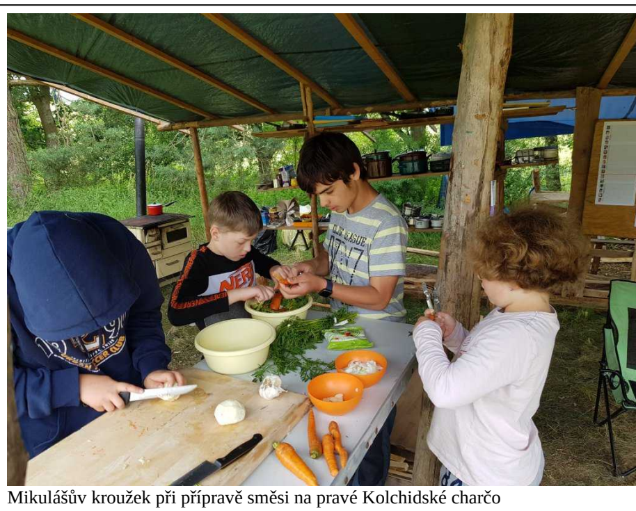
Mikulášův kroužek při přípravě směsi na pravé Kolchidské charčo

poledne k velkému překvapení dětí proběhl první z turnajů, tedy soutěží se silnými handicapými odvíjejícími se od počtu splněných úkolů. Ukázalo se, že pro tuto soutěž bude plnění úkolů opravdu klíčové. Odpoledne nás pak Prtě zavedl do lesa, kde proběhla terénní hra