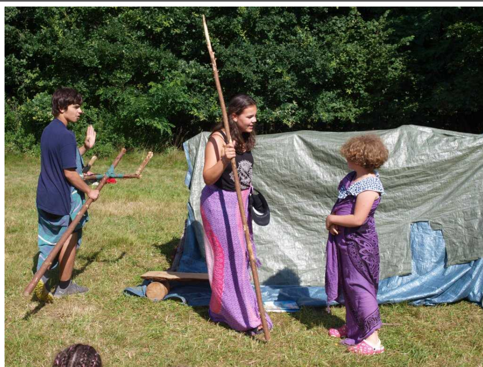
Příběh o Perseovi byl podán v poněkud nečekané úpravě