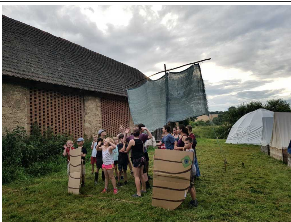
Argó se svou posádkou a právě získaným Zlatým rounem opouští Kolchidu a vydává se na plavbu domů, která bude rovněž plná překážek a dobrodružství.

zákoutí a pokračování, do kterých jsme se herně nepouštěli, ale příběh epochální plavby Argonautů jsme letos na táboře opravdu prožívali.)