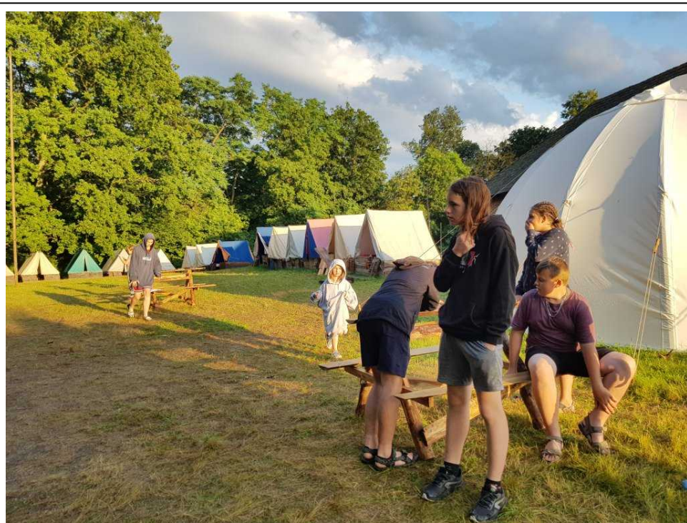
Na poslední hře se sbíraly dvě co nejshodnější sady obrázků