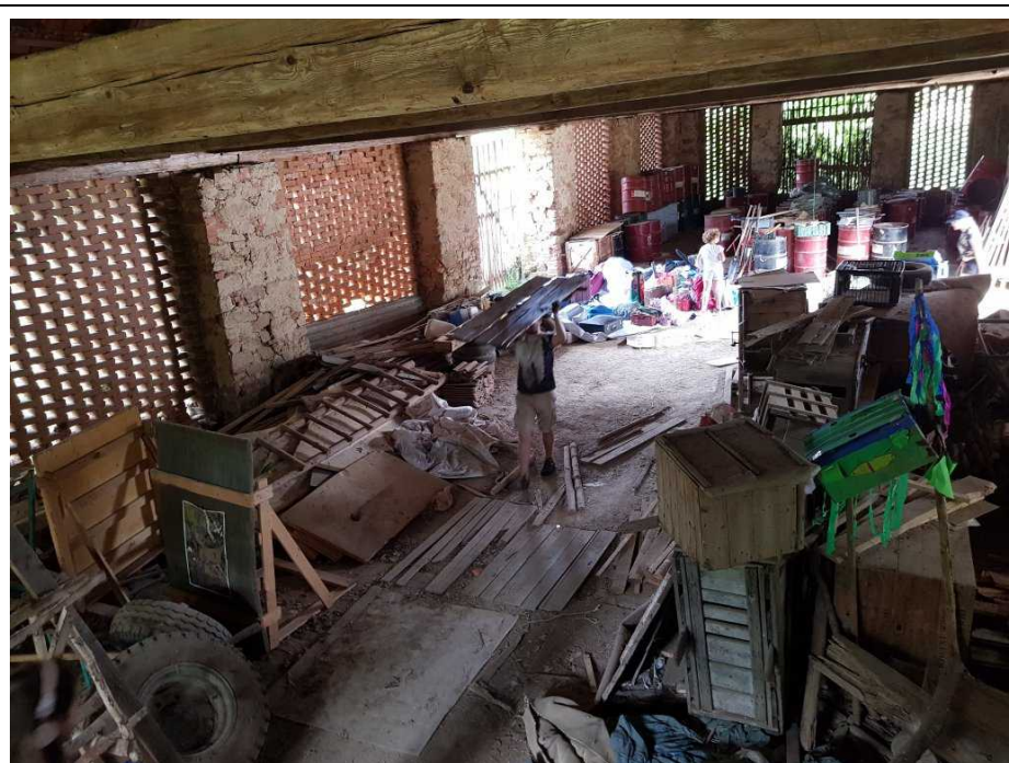
A na závěr všechno složíme do stodoly a vydáme se domů.

Tak a to byl už úplný koneček letošního tábora, pátek a sobota byly naplněné bourací, balící a uklízející prací a předčasnými odjezdy několika dětí, které potřebovaly již v sobotu vyrazit na další cesty, večer jsme se sesedli u grilování a v sobotu dopoledne jsme finálně všechno uklidili, zabalili,