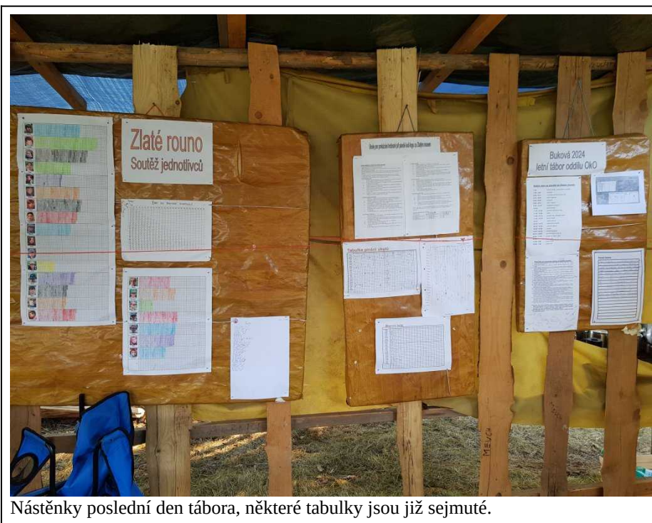
Nástěnky poslední den tábora, některé tabulky jsou již sejmuté.

Výsledky tábora jsou součtem bodů za soutěže a úkoly a v této tabulce si můžete najít, jak jste v které části byli úspěšní. Pro zajímavost loňský