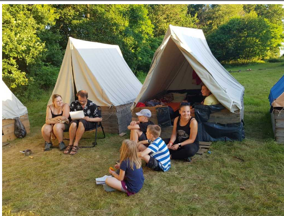
Ve hře na Ostrov Vychloubačů se týmy rozdělily a každý člen odpovídal samostatně

Úterní dopoledne přineslo další sadu kroužků, tentokrát Adam hrál badminton, Bizon se pustil do pečení bábovky na ohni, Piškot se rozhodl upéct pizzu, Hanka vyrazila na houby a Prtě se Zuzkou se vypravili stavět domečky pro Skřítky. Odpoledne pak Piškot uvedl klasickou hru, kdy děti musely postupně bojovat s vedoucími v lese. Večerní hra pak