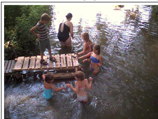
Obrázek přehrady nejspíš neexistuje, tohle je obrázek asi nejvelkolepější konstrukce koupacího mola u prvního mostu v průběhu kroužku malování na kameny v roce 2003

Břeh Merklínky se následně ještě nějakou dobu využíval k mytí, dokonce zde vznikla v jednom roce i malá sauna. Podmínky v Merklínce se však začaly povážlivě zhoršovat, až bylo nutné najít z hygienických důvodů jinou variantu co se mytí mýdlem týče. Navíc prudké deště způsobily, že voda potoka začala podemílat břeh, až se část břehu utrhla. Postupem času byla našťastí dokončena rekonstrukce chaty v Poděvousích, kde byla zavedena i teplá voda. Mytí v Merklínce a pokus o stavbu přehrady tak tedy zůstává ve vzpomínkách oddílových veteránů a pamětníků. (An)