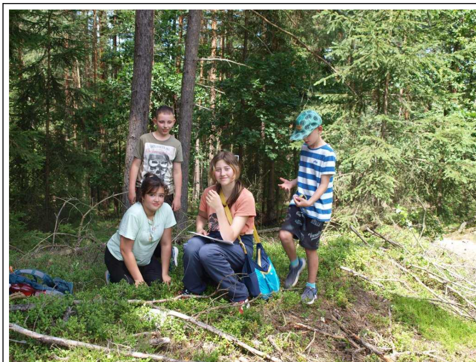
Samostatné chození nás tentokrát zavedlo na Ptenínskou horu

Po nezbytném turnaji a po obědě jsme se pustili do klasických kroužků, kde Tomáš