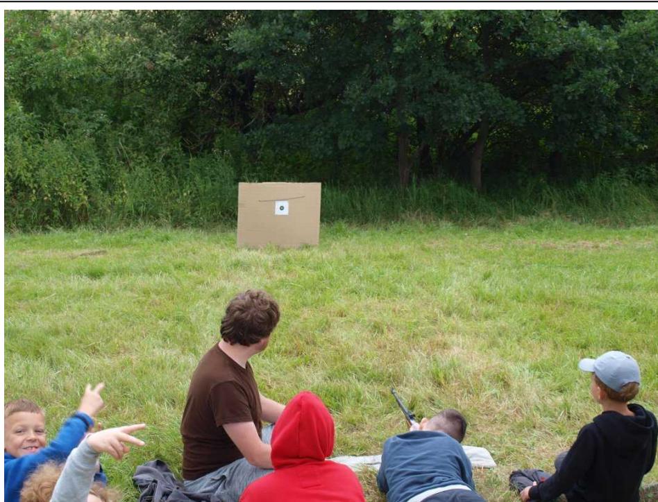
A tady další pohled na OkOspOrt, tentokrát střelba.

Letos přišel OkOspOrt o něco dříve než v minulých letech a tak jsme se věnovali ve čtvrtek sportovnímu zápolení počínaje přespolním během a konče hodem oštěpem. Proběhly všechny tradiční disciplíny a navíc na počest starověkým