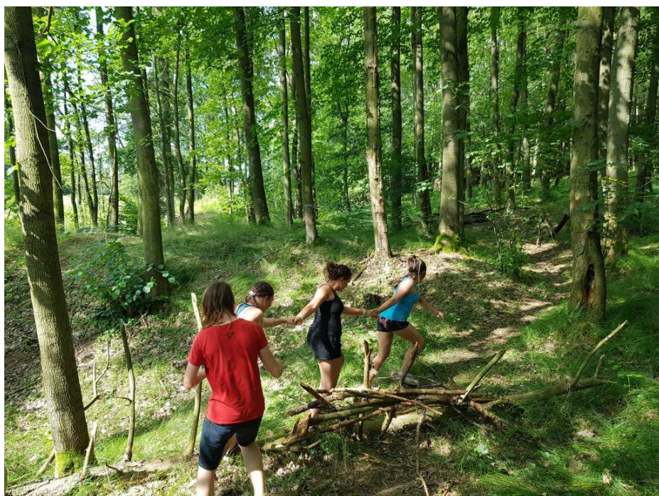
Skupina plavců pluje přes překážky a nesmí se rozdělit.

Večer jsme zapálili slavnostní oheň a tentokrát jsme se pod vedení Statkářky vrátili ke klasické písničkové soutěži.