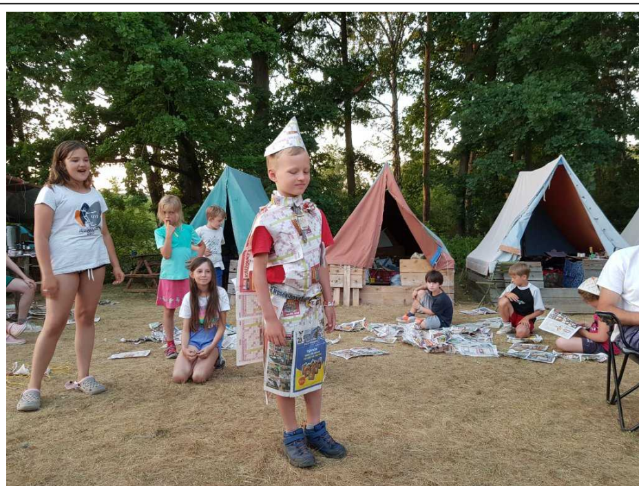
Ondra měl kravatu i Gucci pásek, nejlepší oblek na táboře.

a Statkářka po loňském úspěchu opět uvedla staré dětské hry jako přebírání nebo skákání gummy. V odpolední hře poslal Mikuláš děti na nákup, měly za úkol sehnat předepsané suroviny v obchodech, řízených vedoucími tak, aby to stihli co nejlépe a hlavně aby vyšly s penězi. Ovšem díky ne zcela odhadnutému množství peněz nakonec nevedl občasný dražší nákup u překupníka. Večer