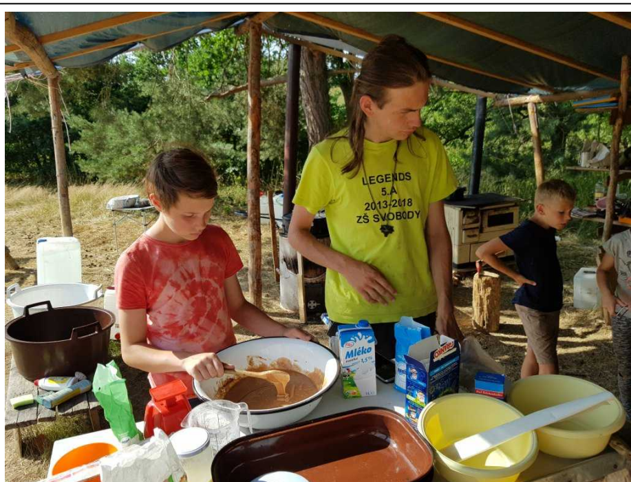
Na závěrečné hře se pečou zákusky pro komisi