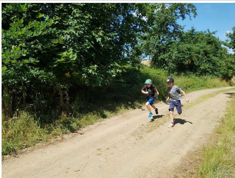
Některé rozběhy závodů na krátkou trať byly velmi vyrovnané.

Pátek prvního týdne nám přinesl sportovní zápolení v disciplínách OkOspOrtu. Kromě