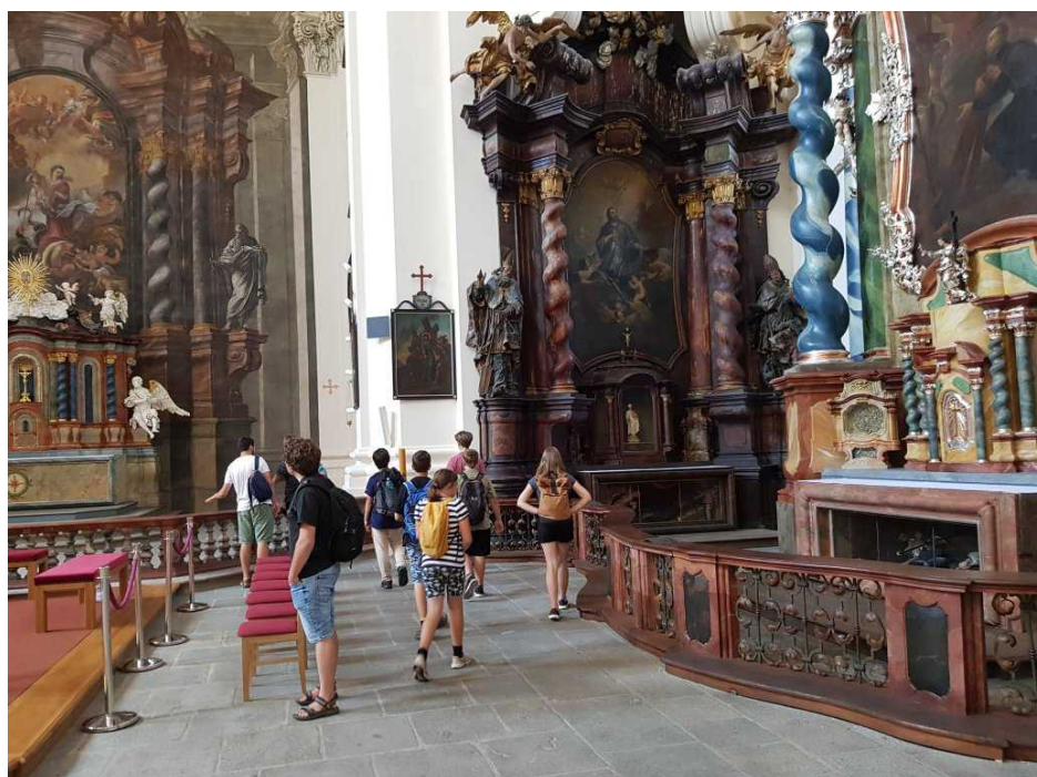
V Klatovech jsme byli na prohlídce Jezuitského kostela

které musely děti na základě informací z receptů vyvrátit.