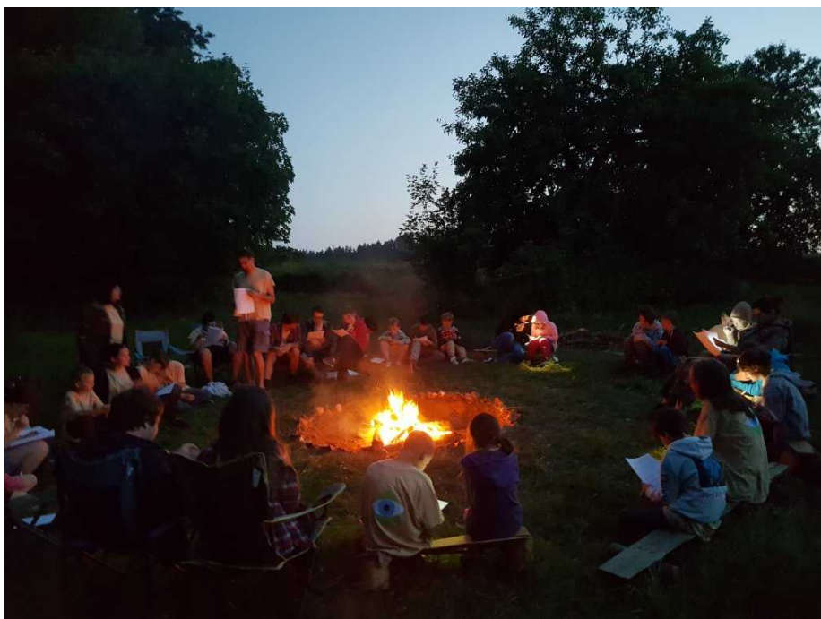
Hra při zahajovacím ohni započala seriál her a soutěží

narovnání stanů na původní místo mírně náročnější, ale vše se podařilo k přijatelné spokojenosti.