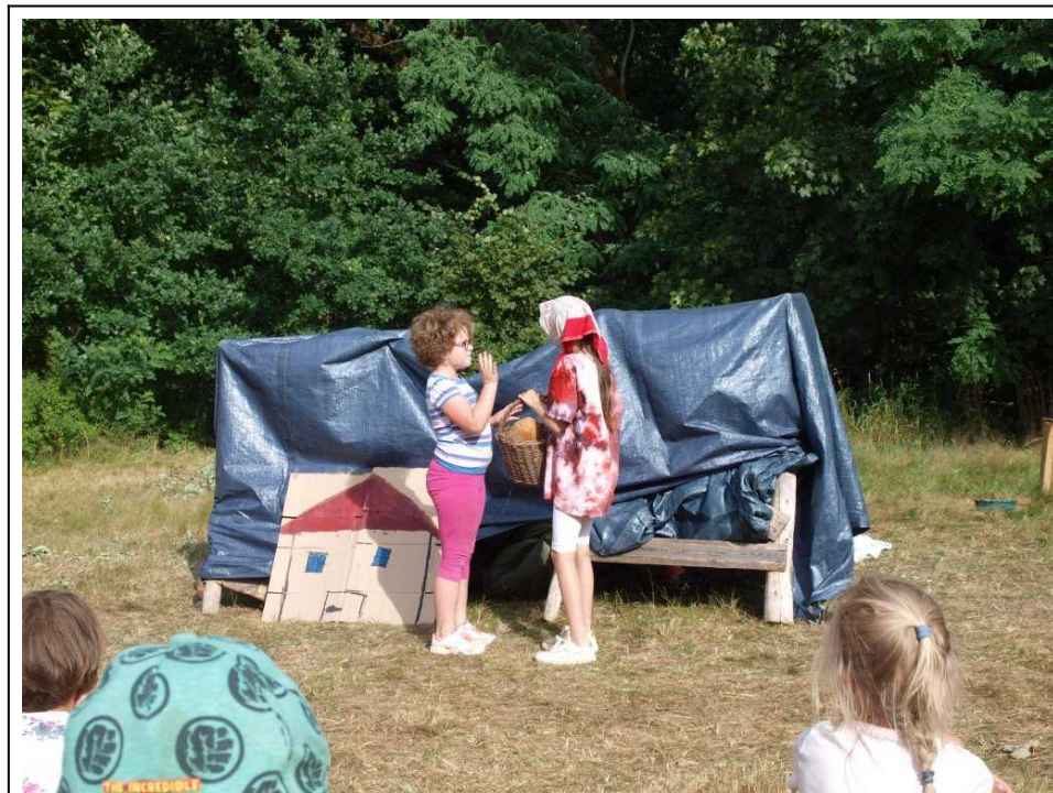
Divadelní představení klasické pohádky Červená Karkulka

Ve středu dopoledne jsme zamířili opět do lesa na Anežčinu hru, kde bylo cílem získat