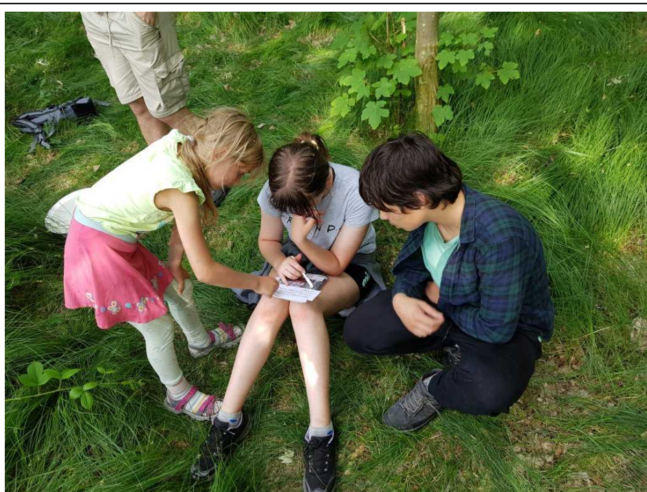
I celkem jednoduchá šifra děti potrápila

Od úterka začala ranní hra, letos jsme z obrázků a popisů určovali různé světové snídaně.