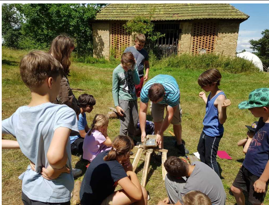
Postavené stoly musely udržet různé předměty

bylo věnováno odborným kroužkům, takže zatímco Bizon šel chytat a poznávat bezobratlé, Žába vyprávěla, co dělat s nalezenými zvířaty, Lembas učil rozdělovat oheň, Mikuláš opět