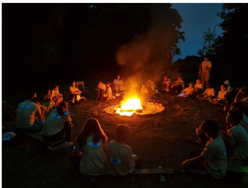
Vyprávění o neuvěřitelných jídlech u druhého táborového ohně.

Náš systém, kdy družiny jsou generovány na základě předešlých výsledků vždy znovu pro