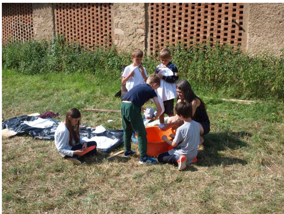
Žába se s dětmi pustila do batikování

Ve středu dopoledne uvedl Piškot hru na stavbu stolů, úkolem skupin bylo nejprve sehnat materiály a pak postavit co nejpevnější stůl, který udrží sadu předmětů. Odpoledne pak Lembas v terénní hře seznámil všechny účastníky s mezinárodními recepty, kdy se měly děti nazpaměť naučit a světovým kuchařům (vedoucí) přeříkat recepty na různá tradiční jídla.