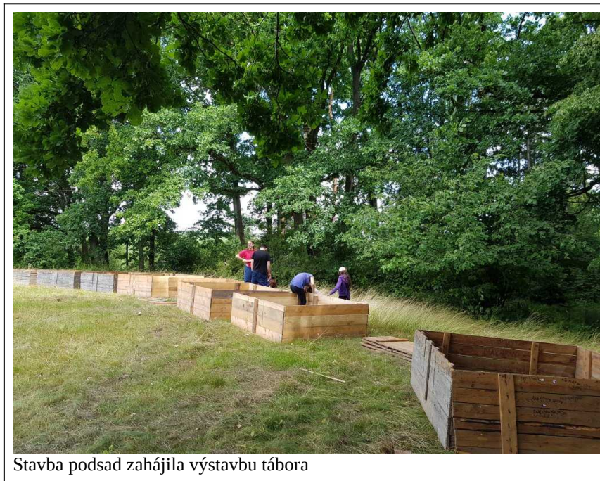
Stavba podsad zahájila výstavbu tábora

Letošní tábor měl nebývalý počet účastníků, proběhl bez větších potíží s počasím, dětmi,