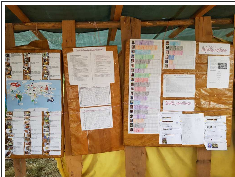
Nástěnky s dlouhodobými soutěžemi a bodováním na konci tábora