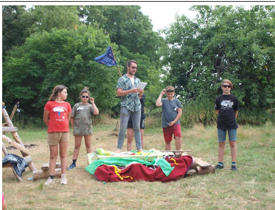
Proslulý zpěvák Lembas Zlatý Hlas zahajuje náš festival.

festival navštívila hodnotící komise, ale i na to jsme byli připraveni a tak byl náš festival oceněn a zařazen mezi nejlepší festivaly.