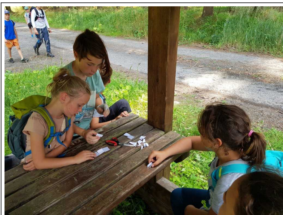
Některé skupiny se na samostatném chození s úkoly mořily.

Pondělí bylo věnované samostatnému chození. Letos bylo koncipované jako jednodenní ve Výtůnském lese nedaleko osady Na Sklárně. Děti měly za úkol vyluštit pět komplikovaných šifer a s jejich pomocí najít pět míst v lese. Přesto, že šifry byly relativně složité, dětem se mimořádně dařilo a ti