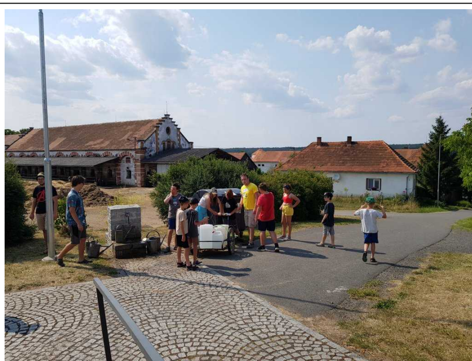
Z Prtětem popisované příhody fotku nemám, pro ilustraci používám foto z tábora 2023, kdy je u vozíku s barely nahoře u kostela značná část tábora a kontejner je již nahrazen menší popelnicí.

Inu stává se, nebylo to poprvé ani naposledy, co jsem zmoknul, ani však nevím proč, ale na tenhle střípek táborové příhody si vzpomenu pokaždé, když se před cestou pro vodu honí mraky. Letos mě však například chytil déšť jen jednou a postačilo se schovat pod stromem v zatáčce pod kostelem.