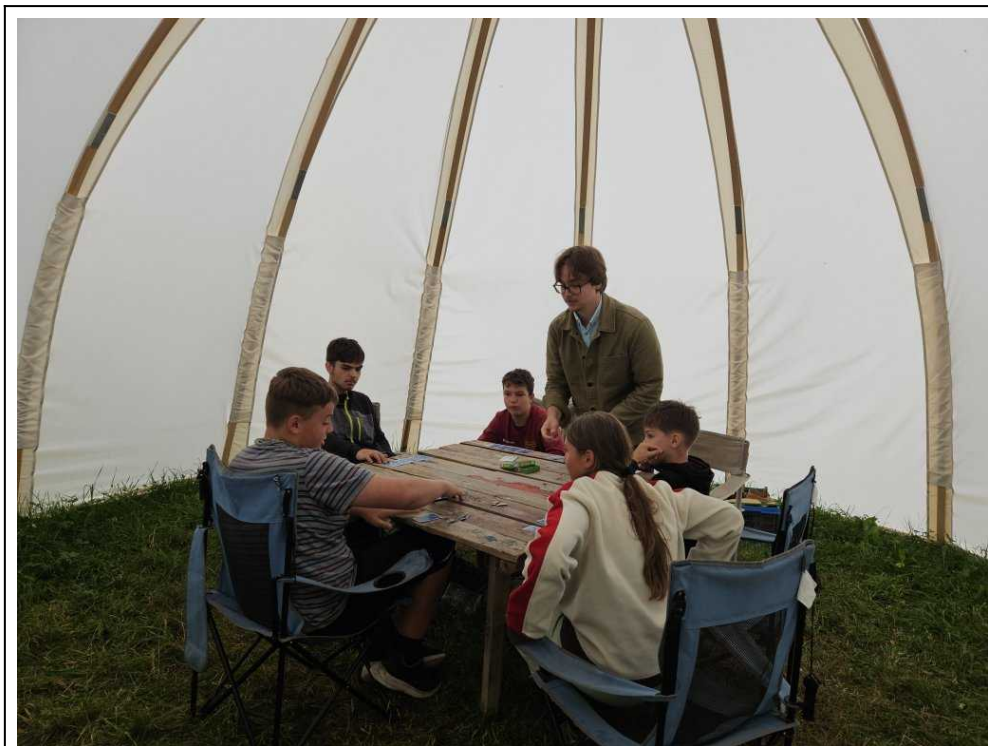
Večer v jurtě se na kroužku hrála i oblíbená Bobří banda

Po divadlech přišly večerní kroužky, které začaly s mírným zpožděním, což některým přidalo a jiným ubralo. Magda zkoušela experimentální fotografické malování světlem,