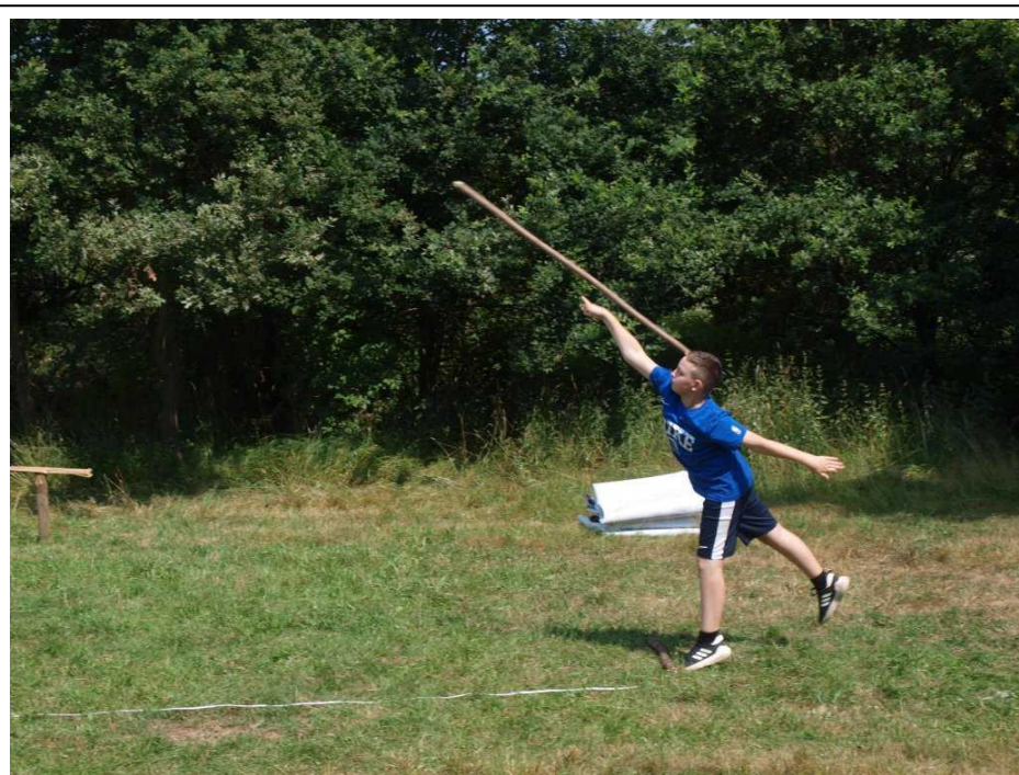
Eda hází oštěpem v rámci OkOspOrtu

V pátek dopoledne nás čekala hra v lese, kde děti hledaly v lese lístky a přitom se