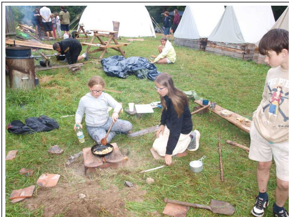
Letošní samostatná vaření zase jednou rušil déšť

Tyrana ze Zloduchu dokázali odhalit a král ho poslal do vyhnanství. Večer se pak rozdávaly odměny pro ty, kdo budou odjíždět.