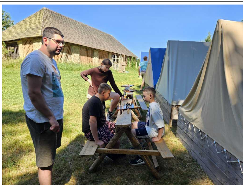
Mezi první kroužky patřil i kroužek šachů

I když se v pondělí ještě dostavovalo a uklízelo, již byla ráno představena ranní hra, která spočívala v kreslení a poznávání obrázků a rovněž průběžná hra, kdy král každé ráno vyhlásil nějaké pravidlo, které se muselo plnit nebo zvláštnost, které si musely děti