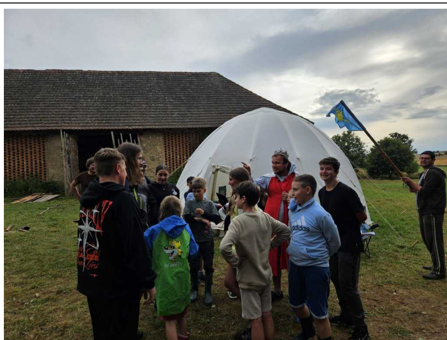
Tyran ze Zloduchu je poslán do vyhnanství

Když jeho Veličenstvo, král Kibic III. řečený Neomylný oznámil svým rádcům, že si hodlá vyhledat dědice, rádcové si vesměs oddechli, protože na jejich panovníka to byla až překvapivě rozumná myšlenka, nicméně, když prohlásil, že dědic bude vybrán na základě zkoušek vymyšlených podle pohádek, bylo jim jasné, že musí opět zpozornět. Kromě očekávaných šlechticů