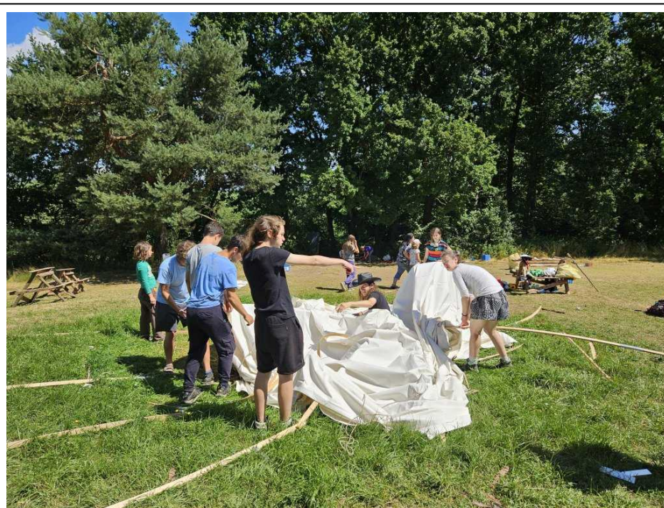
Složení jurty bylo naopak činem snad posledním a pak se už v podstatě jelo domů

oheň, kde jsme rozdávali odměny a zpívali a vzpomínali dlouho do noci. Je pravda, že jsme