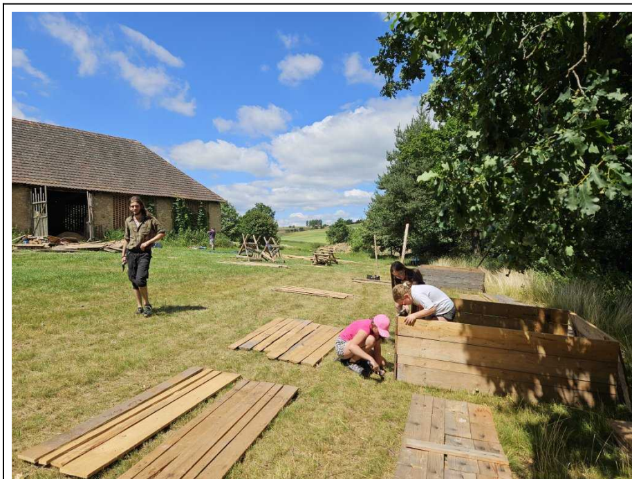
Stloukání podsad letos probíhalo v samostatných dětských skupinách

se na turnaj přihlásil i člen nechvalně známého rodu pánů ze Zloduchu, Tyran. A hned začal podezřele vyhrávat.