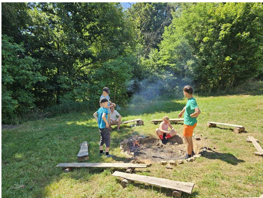
Lembas učí děti zapalovat oheň

královských ministerstvech, děti v lese hledaly vedoucí a u každého musely splnit úkol příslušného ministerstva. Ve večerní hře si pak děti vyzkoušely svou logiku při řazení šlechticů do řady.