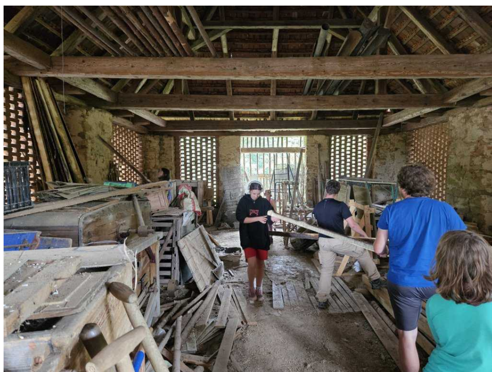
Odnášení prken do stodoly bylo prvním dějstvím balení tábora

Následovala velkolepá hra, kdy se v sérii několika bojů dobýval tábor. Proběhly náročné koulvé bitvy se speciálními úkoly, kdy se stavělo beranidlo a obléhací žebřík až nakonec došlo na dobývání jurty vybavené obranným točitým téměř schodištěm. No a nakonec proběhla korunovace Mikeše na mladšího krále. Čtvrteční dopoledne bylo tradičně odpočinkové a ve čtvrtek večer pak proběhl slavnostní