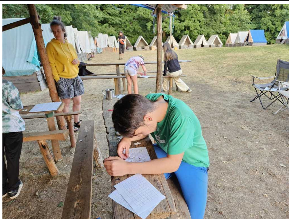
Ve hře na správu vesnic se do čtvercové sítě lepily tvary podle návaznosti

Neděle přinesla sadu kroužků, Prtě vařil jáhlovou kaši, Bizon skládal z papíru, Ariel se pokoušel vyrobit dřevěné uhlí a Piškot střílel z luku. Odpoledne proběhla soutěž na diplomatickou misi, kde bylo úkolem obejít vedoucí, kteří představovali vládců okolních zemí a každému předvést, že znají zvyky jejich země a přinést vhodný dar. Večer proběhla Arielova hra na správu vesnic.