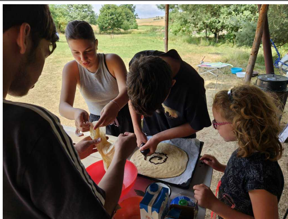
Zdobení chodského koláče bylo společným dílem

V pondělí dopoledne proběhlo utkání v Kibicballu což byla hra, kde král neustále přidával