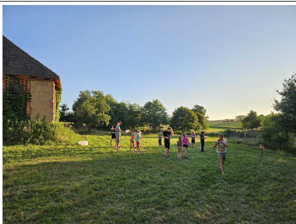
Při hře na znalost zákoníku se musely číst nesmyslné královny texty

V sobotu ráno jsme se dopravili na tábořiště a začali vynášet věci ze stodoly, třídit a následně stavět. Velmi mě potěšilo, že základní stavbu podsad dokázaly zvládnout dětské