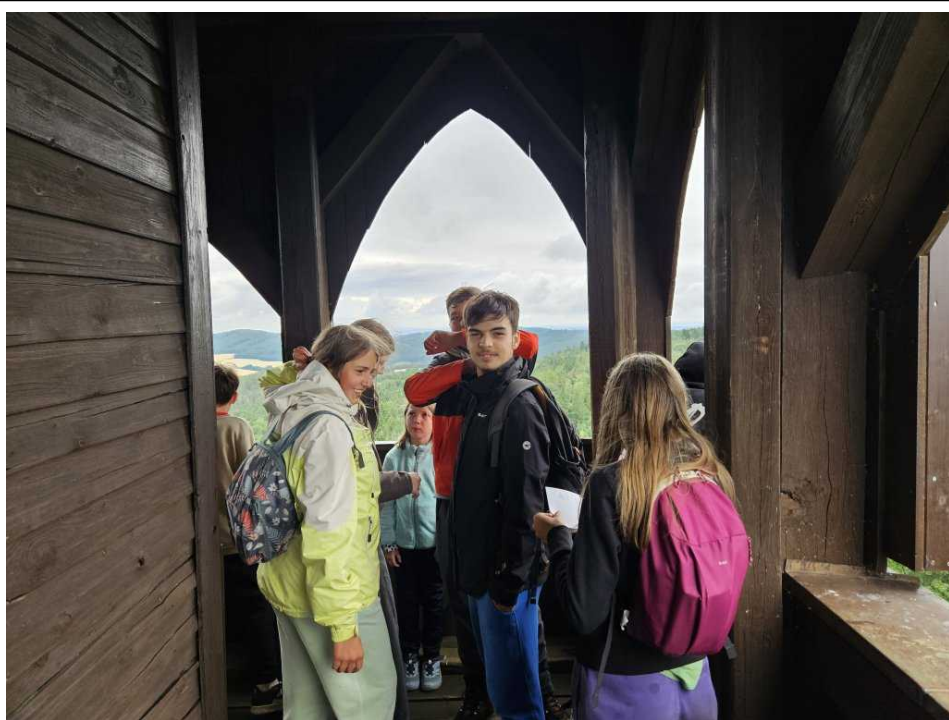
Na ochozu rozhledny Bolfánek

Odpoledne nás čekalo trochu zklamání, protože nám připravenou hru v lese zničil sousední tábor, který les obsadil hrou vlastní a my jsme se