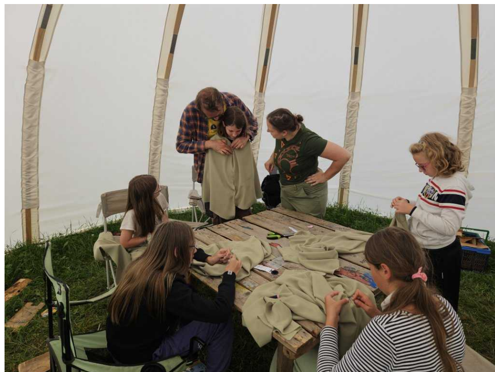
Velmi populárním kroužkem bylo šití plášťů

a u něj uvedl Mikuláš hru na vyprávění příběhu s povinně skrytými slovy. Zejména nás zaujal příběh Ernestův o Karlovi a Benův o kočce. Po setmění ještě proběhla noční hra se sbíráním svítících tyčinek. Po táboře byly rozmístěné svítící tyčinky, které děti sbíraly a vedoucí je chytali tím, že správně řekli jejich jméno, což nebylo na