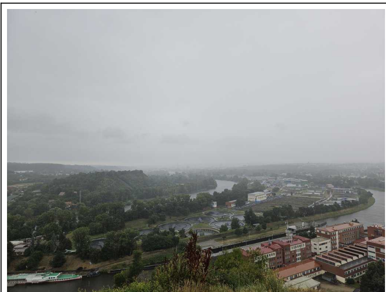
Pohled z Baby do údolí Vltavy v dešti

prohlédnout si opět vltavské skály. A zjistil jsem, že v minulosti mě na letních schůzkách zřejmě tolik netlačil čas a že se vrchol skal stavebně dosti změnil. Na výpravu do další části PR Podhoří mi zkrátka čas nezbyl a musel jsem je nechat na příště. I tak mě zaujala divoká rokle s potokem, kde jsem si připadal jak v džungli jen pár kroků od sídliště.