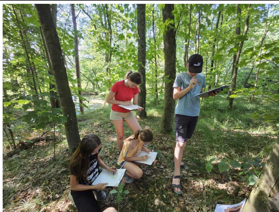
Na ministerstvu portrétů je třeba nakreslit portrét našeho krále.

Úterní dopoledne přineslo konečně kroužky, Mikuláš učil hrát šachy, Lembas pekl egyptské sušenky